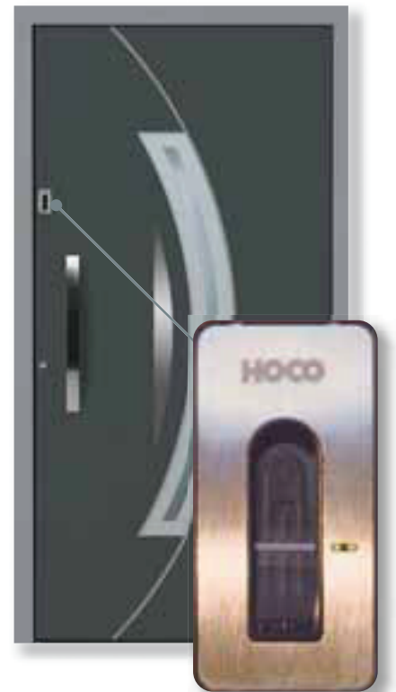
Hoco HTZ 760 Fingerprint mit Edelstahl-Abdeckung