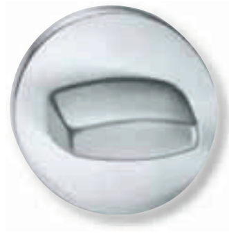
Hoco HTZ 715 Drehrosette für verdeckt liegende Türsperre, EV 1 eloxiert, Dunkelbronze eloxiert, weiß, Messing poliert, Messing brüniert, Edelstahl