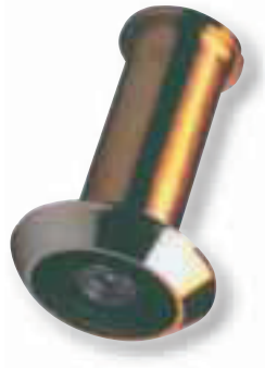
Hoco HTZ 676 Türspion Nickel, Messing, Messing brüniert