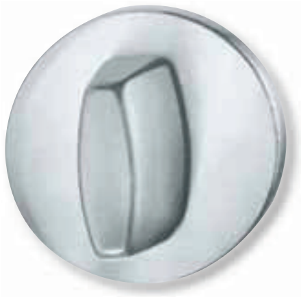
Türverschluss und Türspaltsicherung offen

HOCOsafe, die verdeckt liegende Türsperre verbindet höchste Sicherheit mit Komfort bei täglichem Gebrauch.