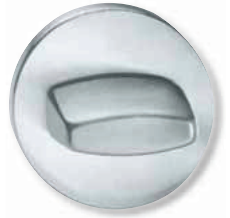
Türverschluss offen - Türspaltsicherung ist verriegelt