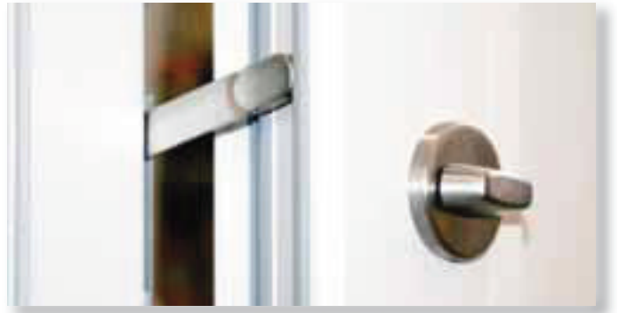
Hoco HTZ 713 verdeckt liegende Türsperre