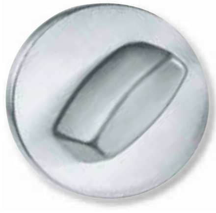
Türverschluss und Türspaltsicherung sind verriegelt