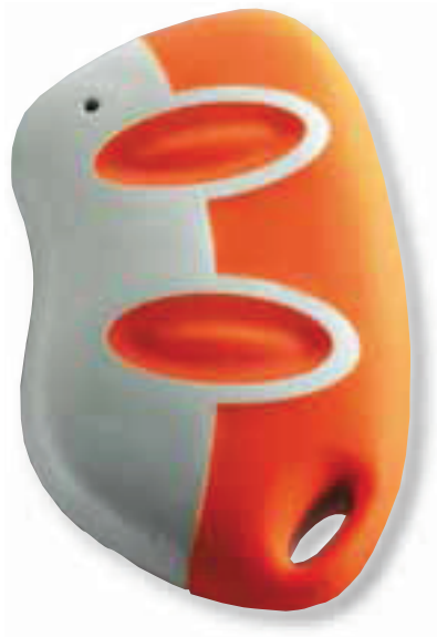
Hoco HTZ 717 Funkfernbedienung weiß/orange weiß/grau