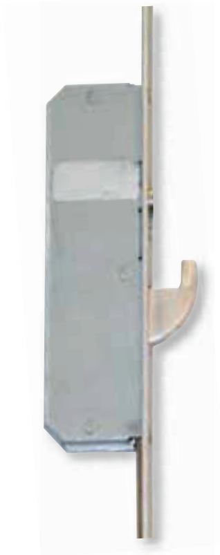
Hoco HTZ 888 Dreifach-Verriegelung