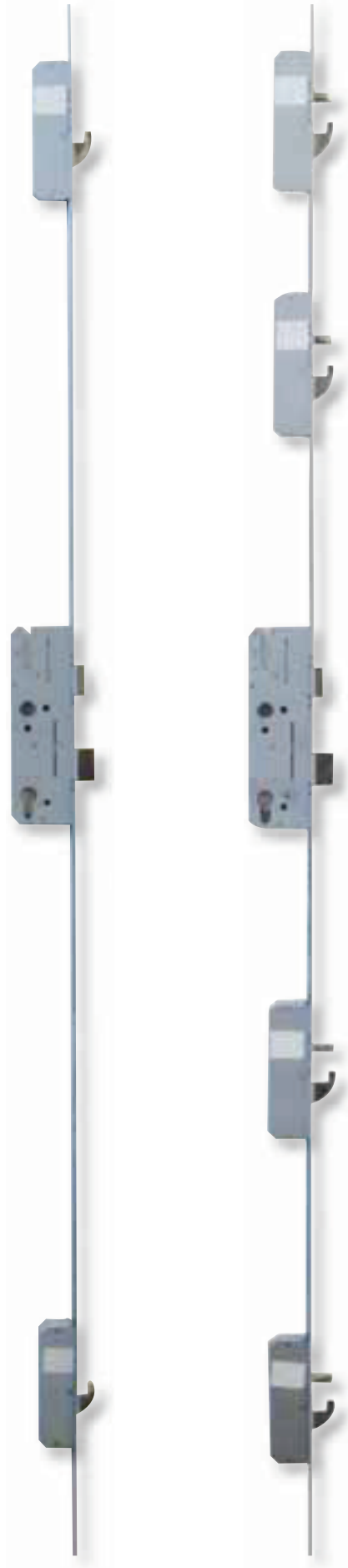
Hoco HTZ 889 9-Fach-Verriegelung