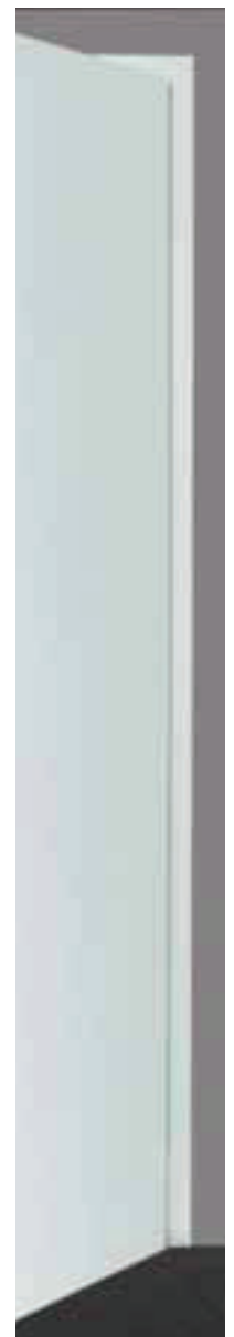
Ausführung flügelüber- deckend