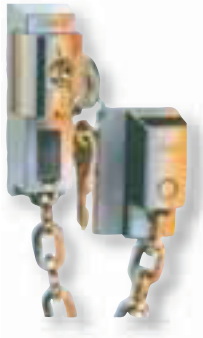
Hoco HTZ 679 Sperrkette Nickel, Messing poliert/weiß