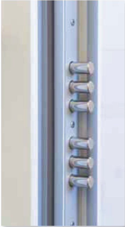
Hoco HTZ 898 17-Fach-Verriegelung